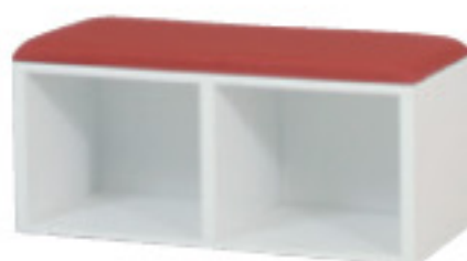
SMB-900(GN) JAN 117767