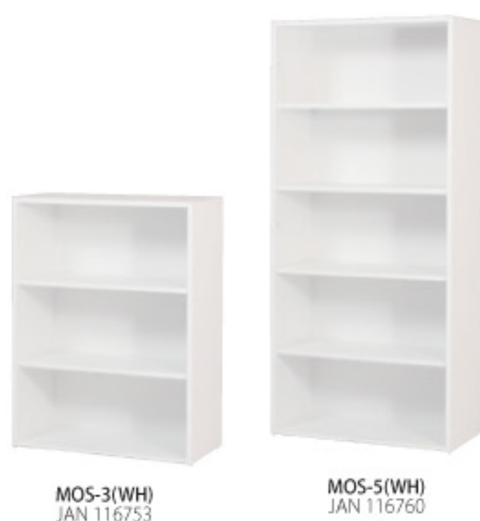
MOS-3(WH) JAN 116753