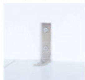
MOS-K JAN 118986