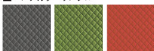
DGR ダークグレー GN グリーン OR オレンジ