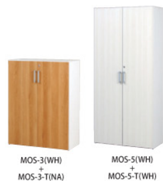
MOS-3(WH) + MOS-3-T(NA)