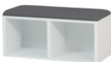
SMB-900(DGR) JAN 117750